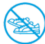
J'évite les efforts physiques