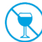
Je ne bois pas d'alcool