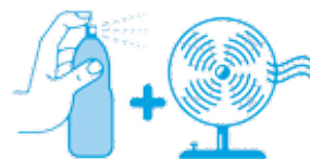
Je mouille mon corps et je me ventile