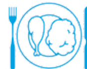
Je mange en quantité suffisante