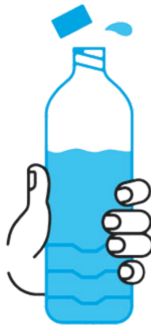
JE BOIS RÉGULIÈREMENT DE L'EAU